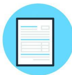
2. Formular ausfüllen

Der Gast scannt am Eingang den QR-Code ein.