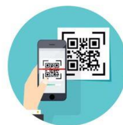
3. QR-Code erneut scannen

In das Formular gibt er unkompliziert seine Kontaktdaten ein.