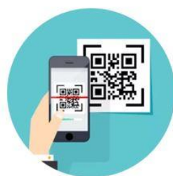
1. QR-Code scannen

Der Gast scannt am Eingang den QR-Code ein.